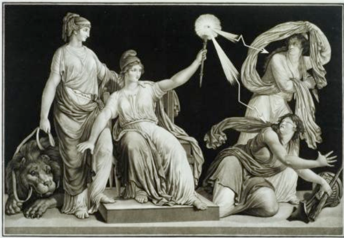
La Liberté avec du Sceptre de la Raison foule aux pieds l'Ignorance et le fanatisme.

Eduquer c'est opérer un décentrement : l'individu – quiet auparavant – comprend bientôt que son esprit est condamné à l'inadéquation et qu'il y a un décalage irréductible entre l'homme et le savoir. En ce sens toute connaissance est une blessure narcissique, dans la mesure où plus on apprend, plus on se rend compte de l'étendue de son ignorance. Pour apprendre, il faut donc renoncer à n'aimer que soi, et comprendre que l'on peut préférer la vérité à soi-même. « L'humilité est la tristesse qui naît de ce que l'homme considère son impuissance ou sa faiblesse. » 7 , dit Spinoza. L'humilité est une tristesse dans la mesure où toute joie d'apprendre s'accompagne d'une tristesse de devoir apprendre. Ce n'est pas la perspective de l'effort à fournir qui attriste, mais le rappel constant de notre misère d'être ignorant. Quiconque apprend regrette