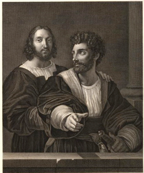
RAPHAEL ET SON MAÎTRE D'ARMES

En latin, le dominus est le maître de la maison ( domus ) ; il possède tout ce qu'il y a dans la maison, êtres humains y compris. Le magister est le maître qui enseigne, qui montre, qui indique. Il n'impose rien mais désigne un chemin qu'on peut suivre. La main du magister montre la vérité mais ne frappe pas. Le fouet est réservé au dominus qui punit l'esclave indocile. Si jamais le maître en vient à frapper le disciple, c'est que l'un des deux a renoncé à la relation d'enseignement et à l'humilité qu'elle exige : soit que le comportement de l'élève signifie son refus d'apprendre, soit que le maître a renoncé à enseigner véritablement, c'est-à-dire à comprendre qu'il ne peut exiger que le disciple s'incline devant lui, et qu'on ne peut forcer personne à vouloir savoir. En ce sens, il semble bien que tout enseignement soit idéalement empreint de douceur : sur le chemin escarpé de la vérité, ceux qui avancent ensemble s'encouragent, se soutiennent et se pressent amicalement.