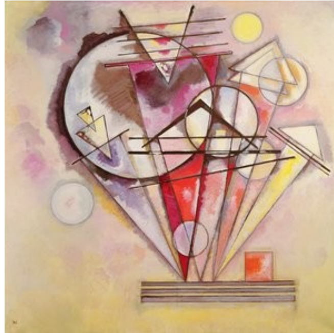
Wassily Kandinsky, On the points , 1928