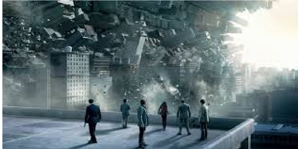
Christopher Nolan, Inception