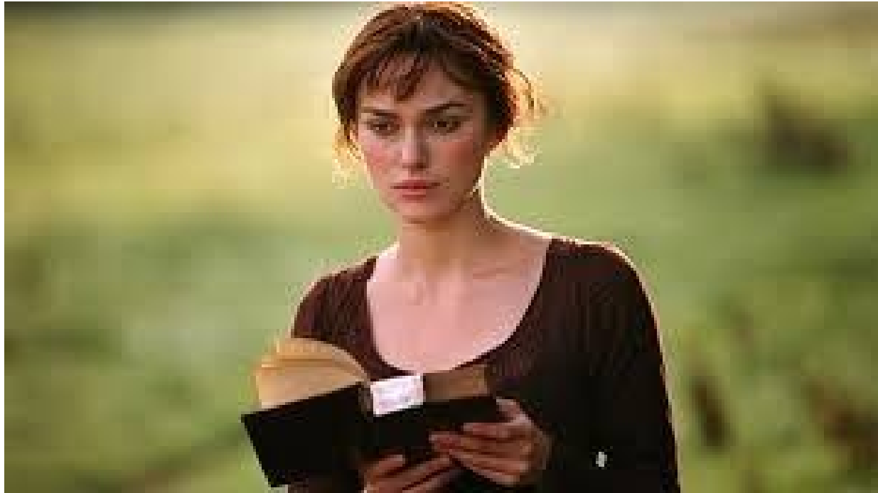
Elizabeth Bennet dans Orgueil et Préjugés de Jane Austen