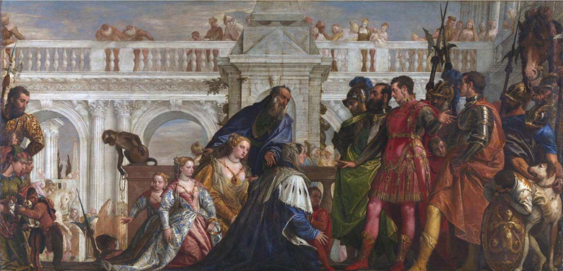
La plus magnanime : La famille de Darius devant Alexandre ( Véronèse) 1570